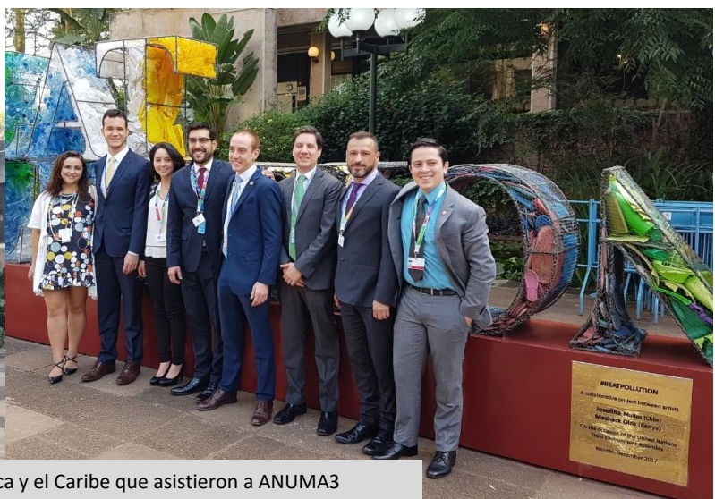
Delegados de Latinoamérica y el Caribe que asistieron a ANUMA3