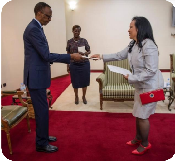
S.E. Presidente Paul Kagame, Embajadora Taylor y Ministra Mushikiwabo