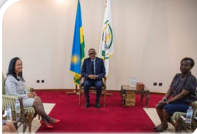
Diálogo Embajadora y S.E. Presidente Paul Kagame