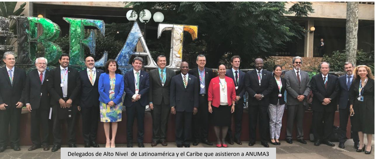
Delegados de Alto Nivel de Latinoamérica y el Caribe que asistieron a ANUMA3