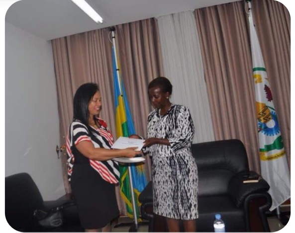
Presentación de copias de estilo de credenciales a Ministra Louise Mushikiwabo