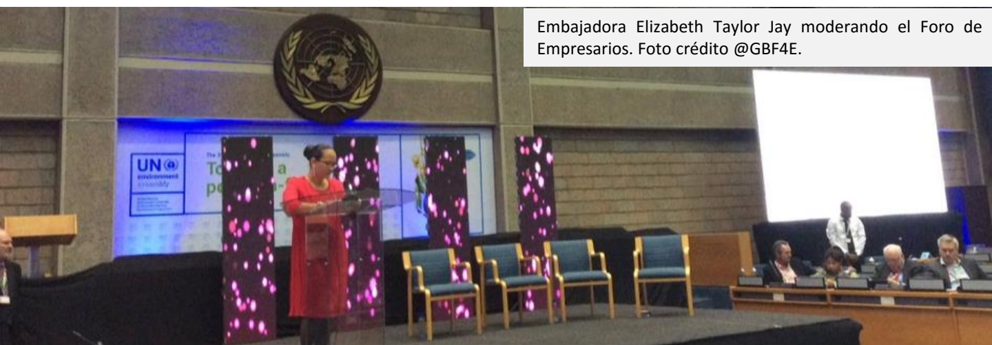
Embajadora Elizabeth Taylor Jay moderando el Foro de Empresarios.

El 3 de diciembre como preámbulo a la celebración de la Tercer Asamblea de Naciones Unidas sobre el Medio Ambiente, la Embajadora de Colombia en Kenia moderó el simposio de negocios enfocado a mirar el papel del sector privado en el cumplimiento de los Objetivos de Desarrollo Sostenible. El foro contó con un selecto grupo de empresarios de las diversas regiones del mundo, quienes expusieron las buenas prácticas y los enfoques de sus negocios para proteger el medio ambiente, al tiempo que se vuelven productivos. Se aprovechó el espacio para generar un diálogo entre el sector privado, los gobiernos y la sociedad civil.