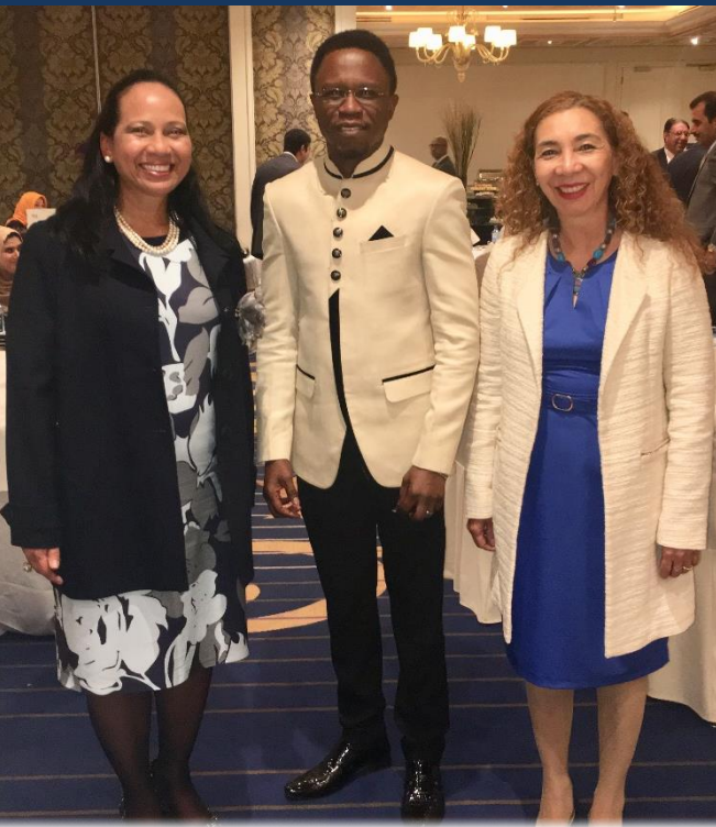
Embajadora de Colombia en Kenia, Viceministro Administrativo de la Cancillería de Kenia y Embajadora de Costa Rica

El Ramadán es el noveno mes del calendario musulmán, conocido internacionalmente por ser el mes en el que los musulmanes, por su fe y por sus creencias, practican el ayuno diario desde el alba hasta que se pone el sol. Este ayuno se hace además en solidaridad con las personas que no tienen la posibilidad de contar con alimento habitual en sus mesas.