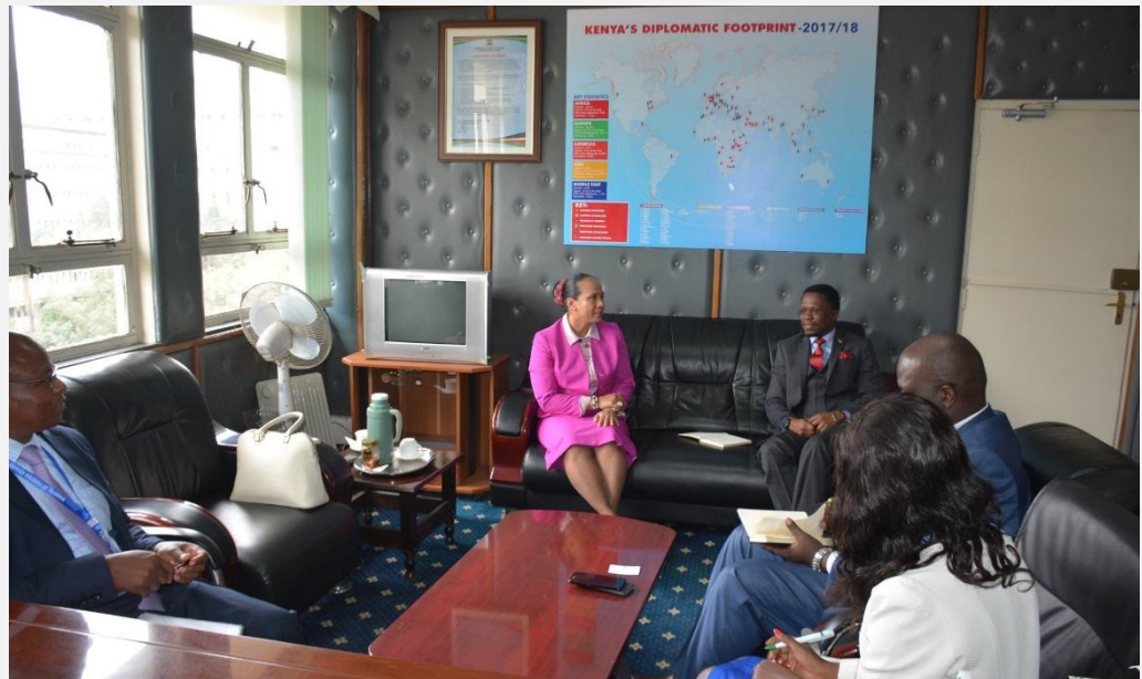
Embajadora Elizabeth Taylor, con Viceministro Administrativo de la Cancillería de Kenia, sr. Ababu Namwamba y su equipo de trabajo

El Viceministro igualmente expresó interés en continuar los diálogos con Colombia en materia de deportes y cultura, esto al manifestar su admiración por el progreso que ha tenido el deporte en nuestro país y su destacada representación en el Mundial de Futbol de Rusia.