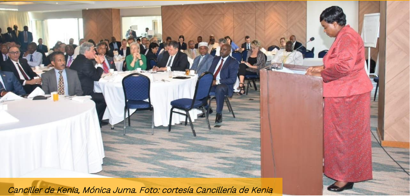
Canciller de Kenia, Mónica Juma.