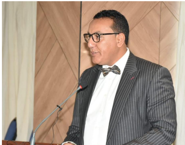
Ministro de Turismo de Kenia, Najib Balala.

El Ministro de turismo Gobierno de Kenia Sr. Najib Balala también intervino en la reunión para invitar a los países a mantener la confianza en la seguridad para viajar al país africano. Anunció que estaría visitando varios países con el fin de entrevistarse con los medios de comunicación y agencias tanto gubernamentales como privadas para responder inquietudes y seguir promoviendo a Kenia como un importante destino internacional de turismo.