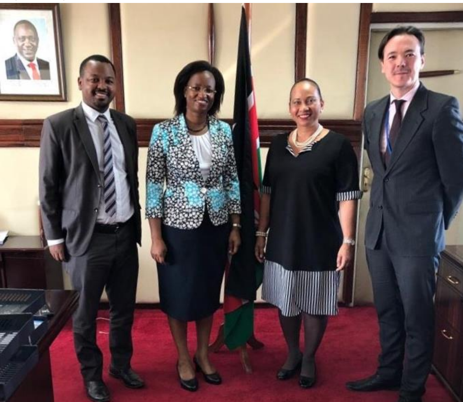
Equipos de la Embajada de Colombia en Kenia y el Viceministerio de Cooperativas de Kenia

Especial interés manifestaron los funcionarios en conocer sobre el manejo de las cooperativas y asociaciones relacionadas con el café en Colombia y conocer las experiencias en generar productos adicionales incluyendo las actividades de turismo asociadas a la actividad de producción. Los funcionarios de la Embajada aprovecharon la oportunidad para proporcionar información general sobre el país y sus riquezas.