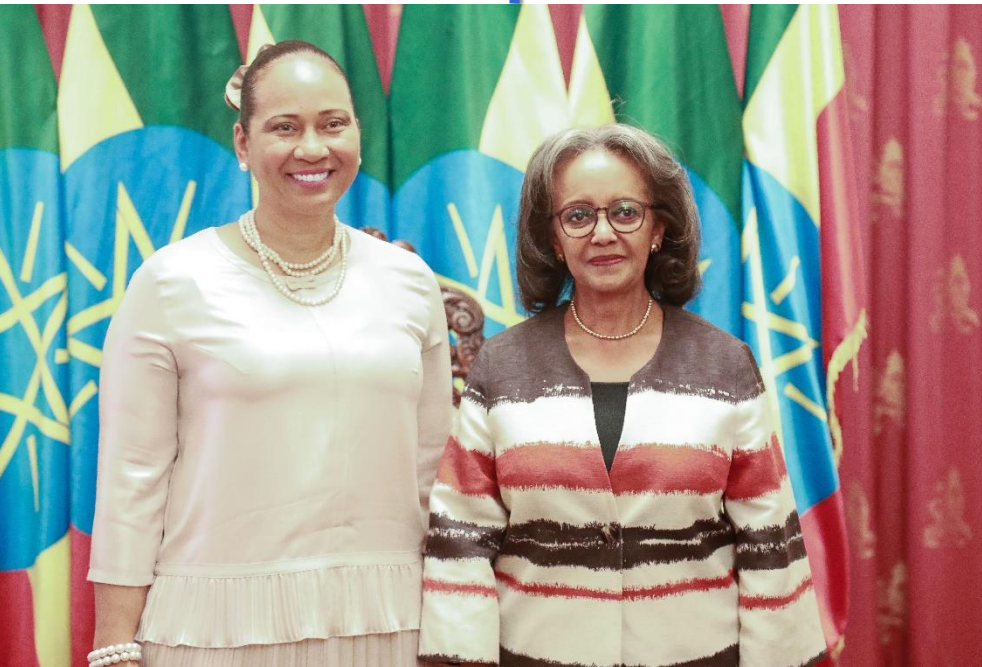
Embajadora de Kenia con Presidenta de Etiopía.