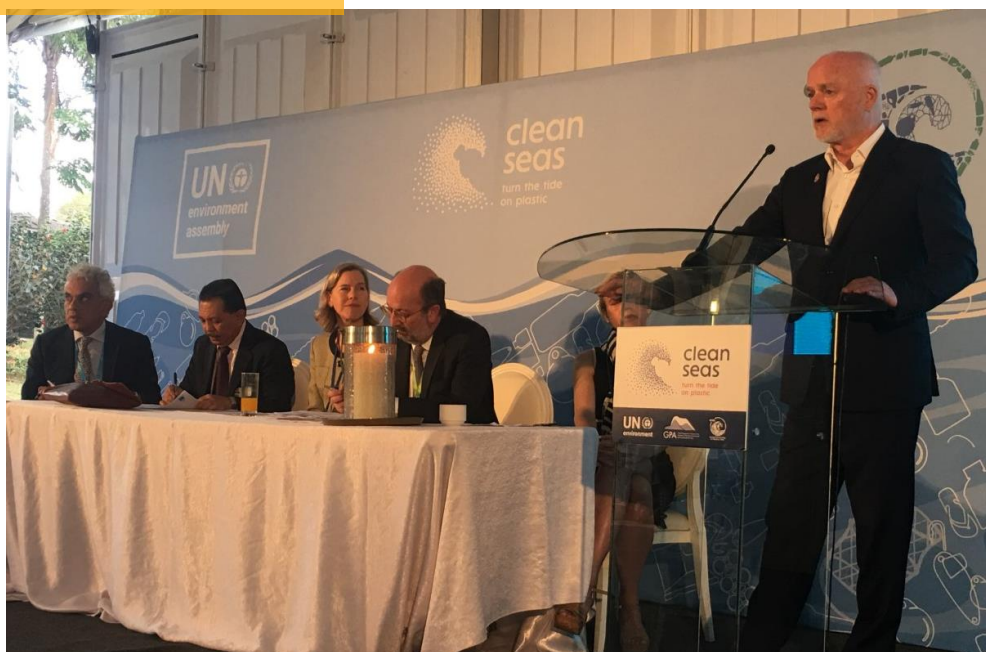
Peter Thompson, Enviado Especial de los Océanos de Naciones Unidas

En el panel de discusión participaron la Directora de Océanos del Pnuma, el Enviado Especial de Naciones Unidas para los Océanos, los Ministros de Ambiente de Indonesia y de Portugal, este último país será el anfitrión de la gran conferencia sobre océanos de Naciones Unidas que se celebrará en la ciudad de Portugal en 2020.