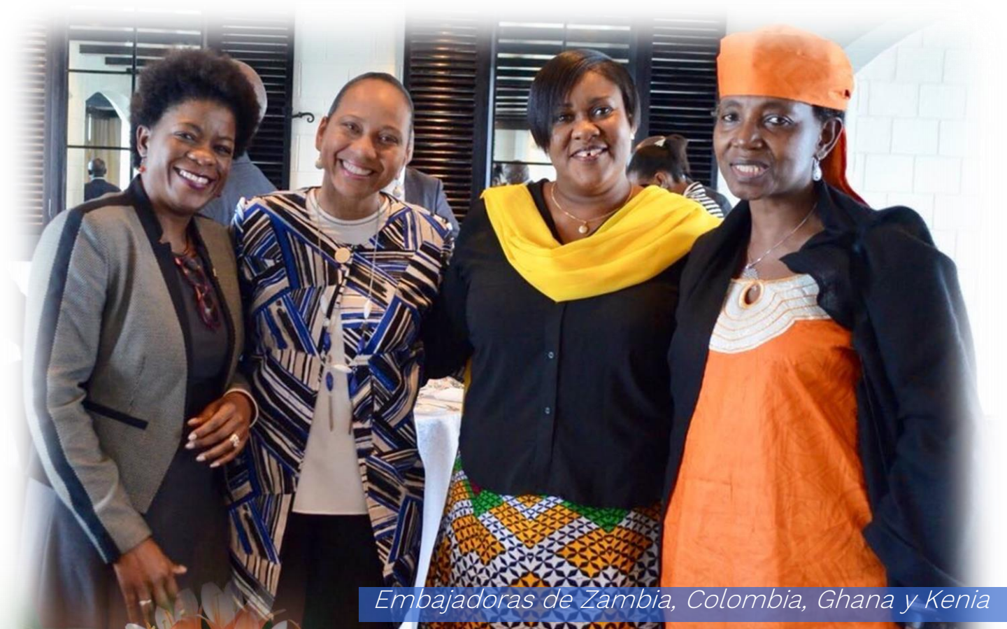
Embajadoras de Zambia, Colombia, Ghana y Kenia