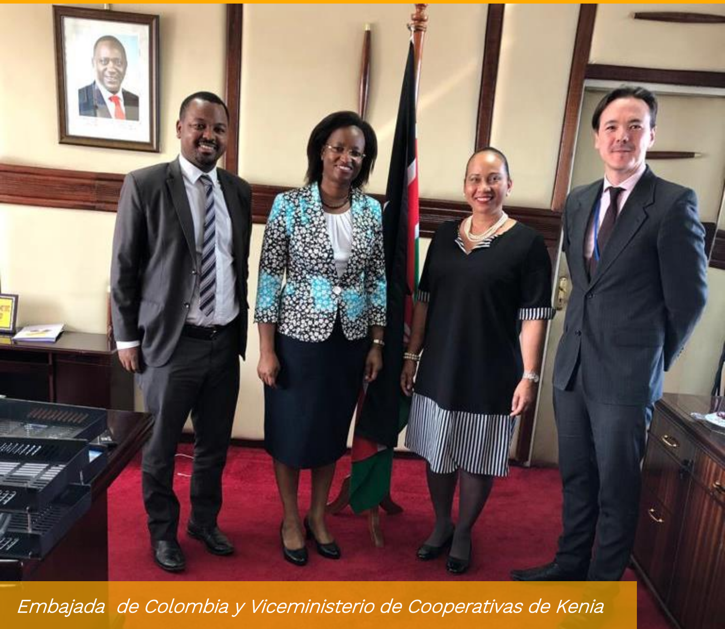
Embajada de Colombia y Viceministerio de Cooperativas de Kenia

Del 4 al 10 de marzo funcionarios de los Ministerios de Industria y Cooperativas y de Agricultura de Kenia realizaron visita de evaluación comparativa a Colombia, con el propósito de conocer la experiencia cafetera del país. La gira se organizó desde Kenia con el apoyo de la Embajada de Colombia en Nairobi con quienes el Viceministerio de Cooperativas del Ministerio de Comercio e Industria de Kenia celebró sendas reuniones preparatorias. En la organización de la gira también participaron la Dirección de Asia, África y Oceanía del Ministerio de Relaciones Exteriores y los contactos establecidos con la Gobernación de Caldas y el Municipio de Chinchiná.