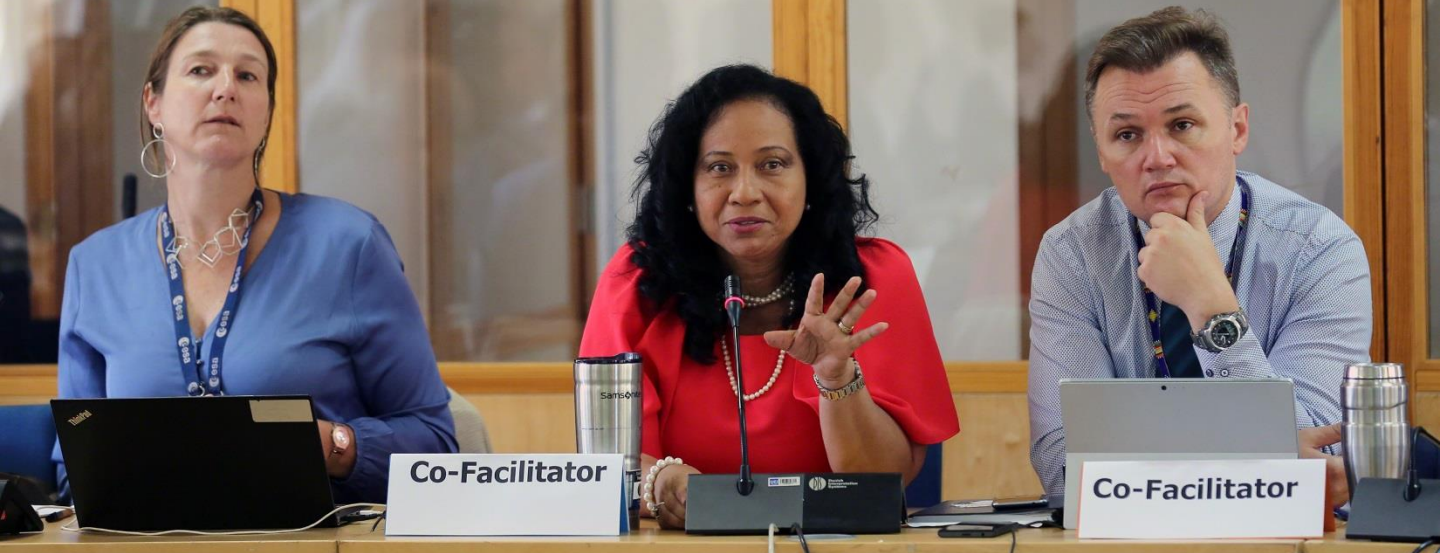
Embajadora en Kenia, Representante de Canadá y del Pnuma en la co-facilitación de las negociaciones para la UNEA 4.