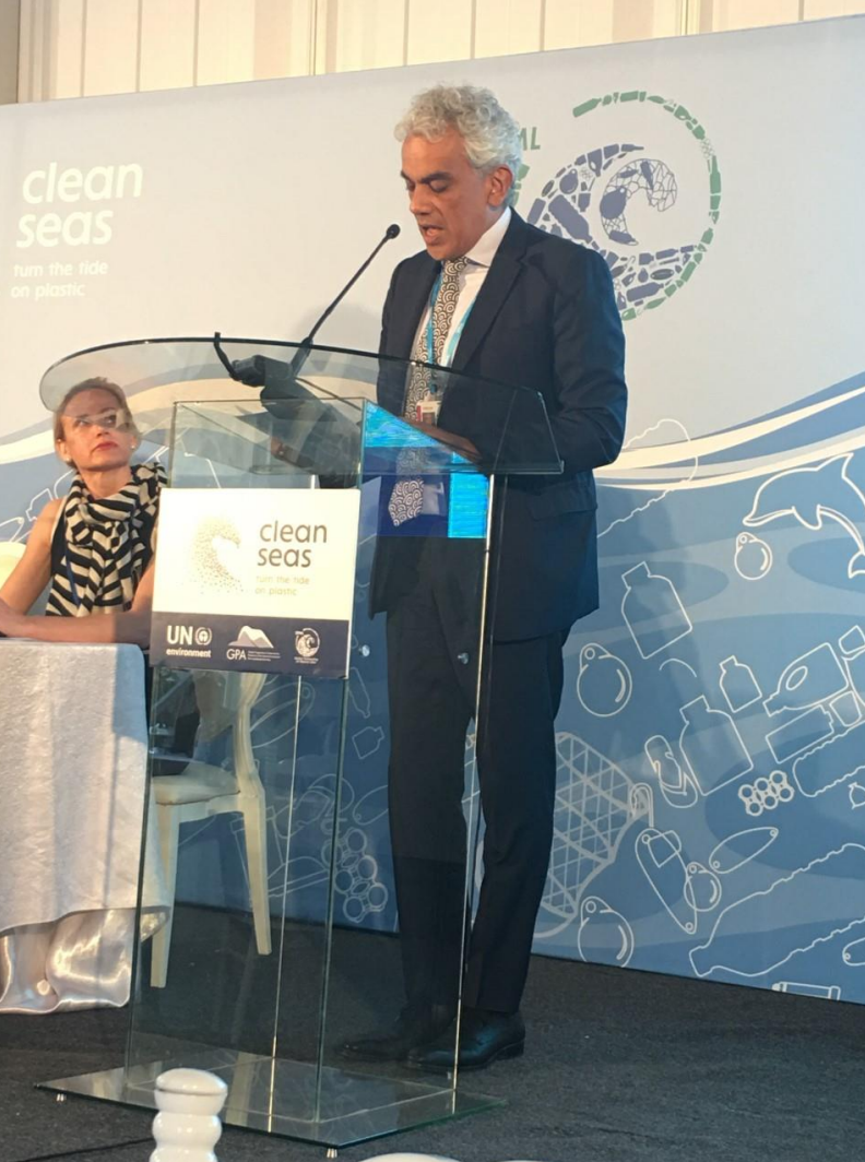
Ricardo Lozano Picón, Ministro de Ambiente y Desarrollo Sostenible

El Ministro de Ambiente y Desarrollo Sostenible, Ricardo Lozano Picón, con el apoyo de la Embajada de Colombia en Kenia, participó el pasado 14 de marzo en Nairobi en el panel de discusión sobre la dirección colectiva estratégica hacia mares y costas sostenibles, en el marco del desayuno celebrado por el Pnuma frente al cumplimiento de los objetivos para el cuidado de los océanos para el 2020.