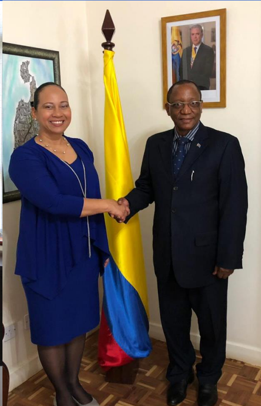
República Democrática del Congo