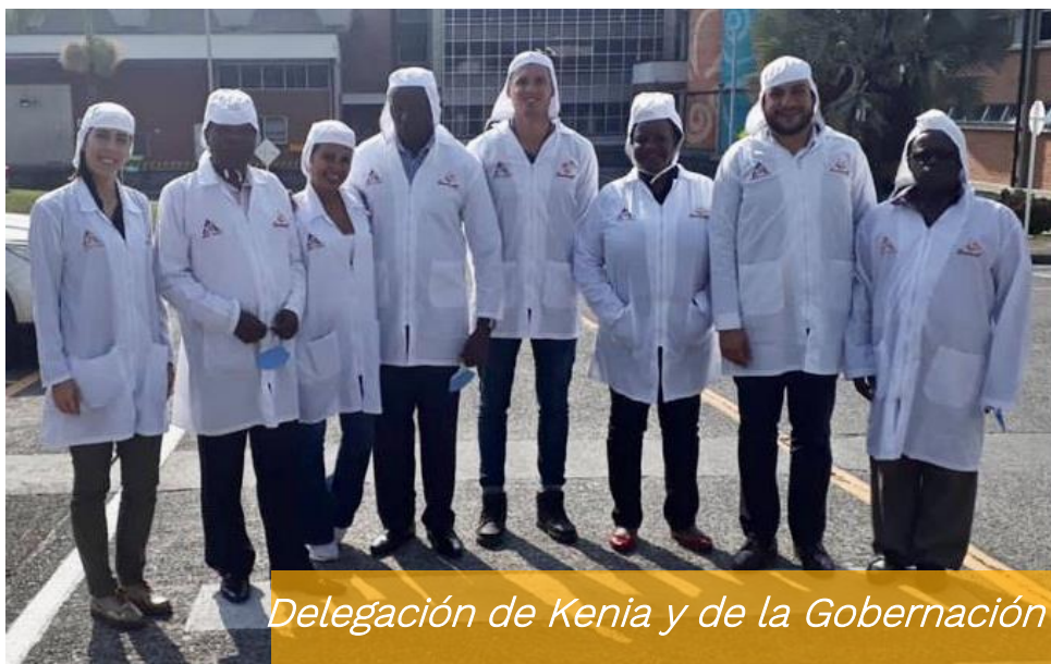
Delegación de Kenia y de la Gobernación de Caldas

La delegación también visitó el centro de Bioinformática y Biología Computacional BIOS, donde se compartió conocimiento sobre el uso de tecnología analítica para el mejoramiento de las cadenas de producción y comercialización del café. Presentación de desarrollos realizados por el Centro BIOS en el uso de tecnología analítica usado para el mejoramiento de las cadenas de producción y comercialización del café.