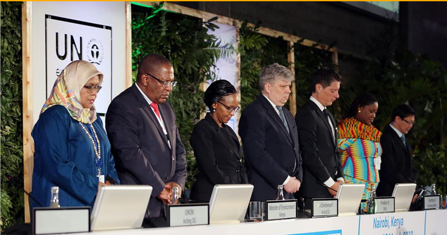
Mesa Directiva y Representantes del Gobierno de Kenia y Naciones Unidas en Ceremonia de apertura de la Cuarta UNEA.

La cuarta sesión de la Asamblea de las Naciones Unidas para el Medio Ambiente (UNEA-4) se inauguró el lunes 11 de marzo en Nairobi, Kenia, con el tema central “Soluciones Innovadoras para los retos ambientales y el consumo y la producción sostenible”.