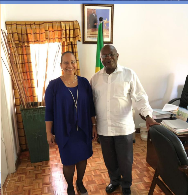
República del Congo