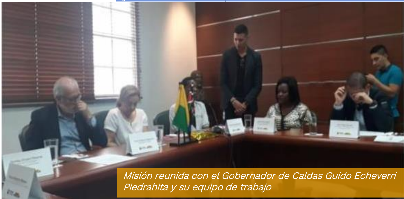
Misión reunida con el Gobernador de Caldas Guido Echeverri Piedrahita y su equipo de trabajo

El sábado 9 de marzo sostuvieron un almuerzo con el Gobernador del Departamento de Caldas, Guido Echeverri Piedrahita, y miembros de su equipo de gobierno en las instalaciones de la Gobernación. Las secretarías de Agricultura y de Integración y Desarrollo Social acompañaron el almuerzo y expusieron las estrategias departamentales en beneficio de la caficultura.