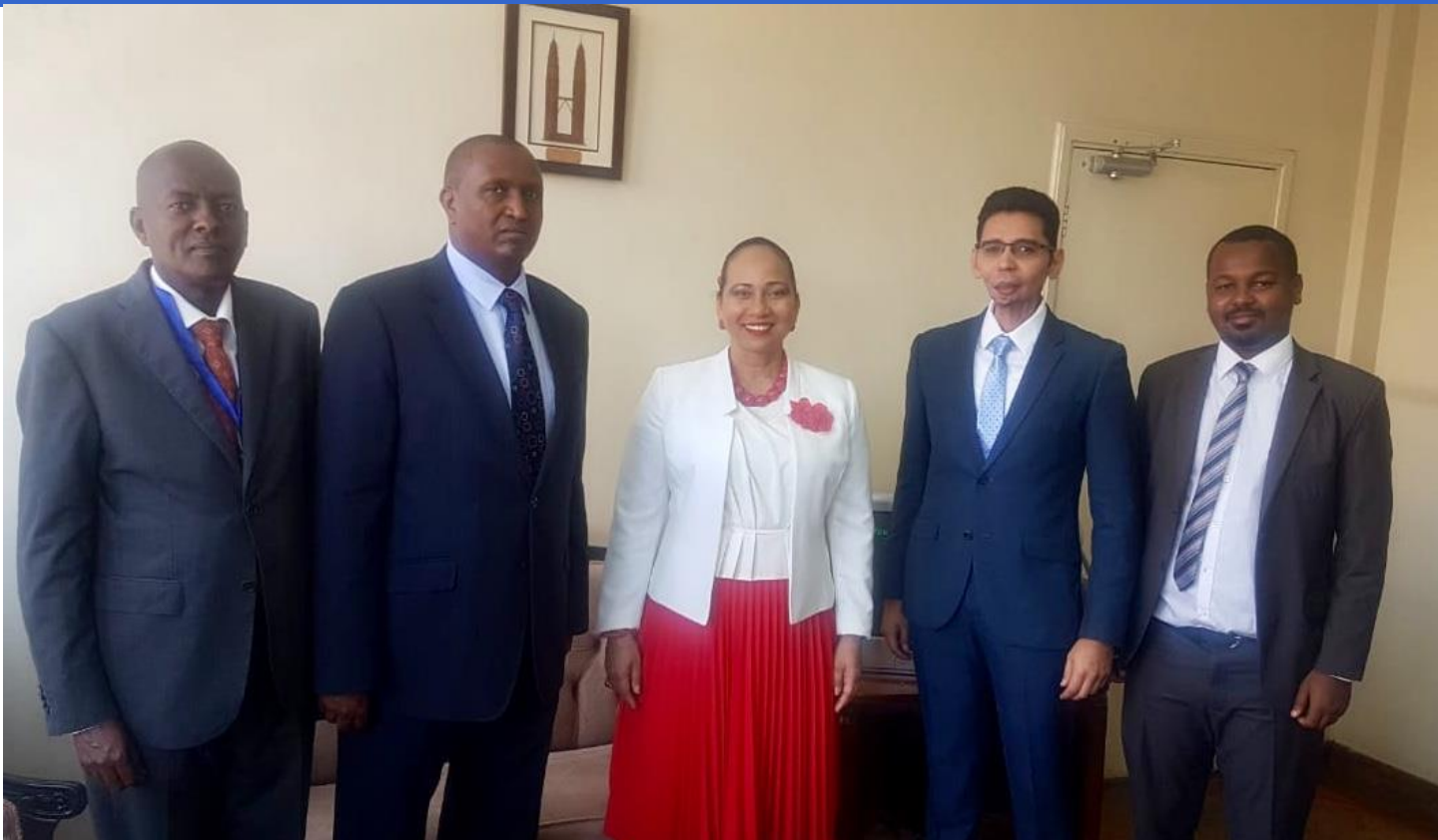
Embajadora y Cónsul con Director de Américas y Equipo de la Cancillería de Kenia