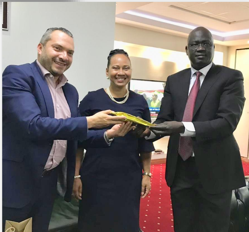
La República de Sudan del Sur es uno de los países concurrentes de la Embajada de Colombia en Kenia.

Director y la Embajadora Taylor aprovecharon la oportunidad para entregar al Embajador de Sudan del Sur un café de alta calidad producido por un grupo de excombatientes dentro de los programas de reintegración que lidera el gobierno colombiano.