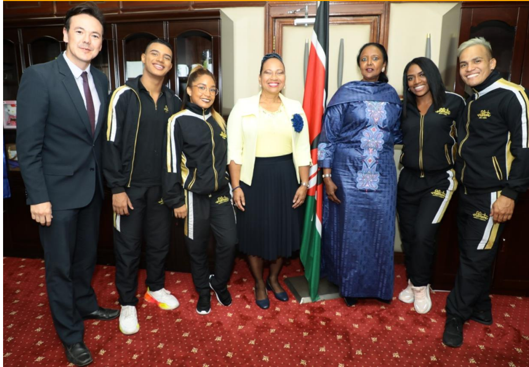
Equipo de la Embajada, ENSÁLSATE y Ministra de Deportes, Cultura y Patrimonio de Kenia

Como preámbulo a las diversas actividades que se estarían desarrollando con la presentación de salsa en Nairobi, el pasado 26 de septiembre la Ministra de Deportes, Cultura y Patrimonio de Kenia Embajadora Dra. Amina Mohamed recibió en sus oficinas a los cuatro integrantes de la agrupación ENSÁLSATE que llegó a Nairobi para realizar la actividad cultural liderada por la Embajada de Colombia en Kenia en el marco del Plan de Promoción de Colombia en el Exterior 2020.